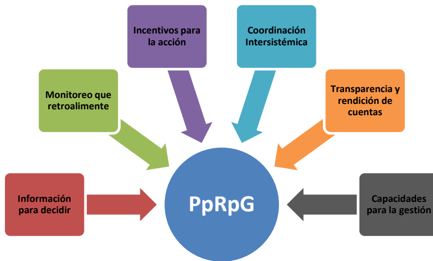
Ilustración 1: Componentes del PpRpG